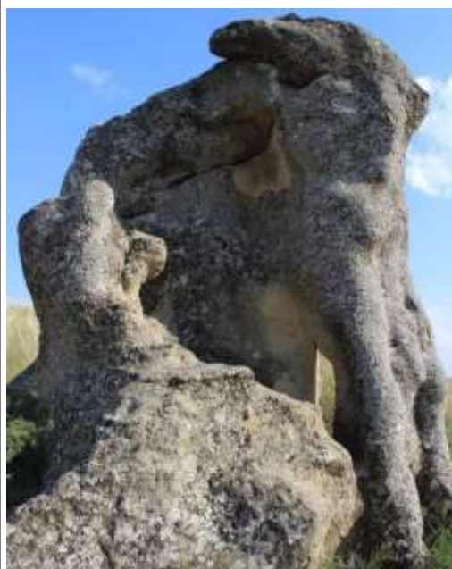
Каменные слоны (Каменные столбы)